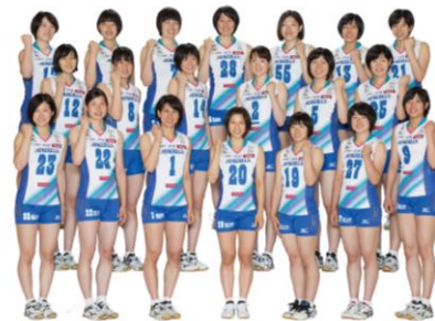
<岡山シーガルズとの共同開発により誕生>

※2 セラミド NS、セラミド NP、セラミド AP、セラミド EOP、セラミド EOS(保水成分)