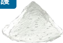
W ライトカットパウダー