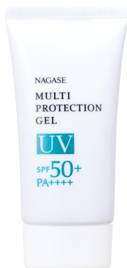
ナガセ マルチプロテクション UVジェル [日やけ止め(ボディ用)] 50g 3,700円(税抜)

長瀬産業株式会社(本社:東京都中央区/代表取締役社長:朝倉 研二)の100%子会社である、株式会社ナガセビューティケア(東京都中央区日本橋本町1-2-8/代表取締役社長:千葉敏英)では、2021年4月1日、紫外線をしっかり防ぎながらブルーライト等の環境ストレスからも肌を守る高機能日やけ止め「ナガセ マルチプロテクション UV ジェル」を新発売いたします。