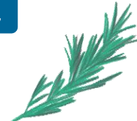
ローズマリーエキス NAL