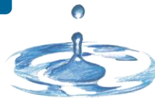
スーパーヒアルロン酸