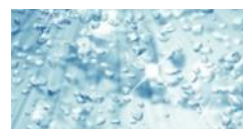
コラーゲンペプチド