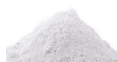
N-アセチルグルコサミン