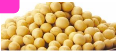
大豆エキス発酵物

美しさに欠かせない成分、イソフラボンを多く含む大豆を黒麹菌で発酵させて、新たな力をプラス。美しさにさらなる活躍が期待できます。